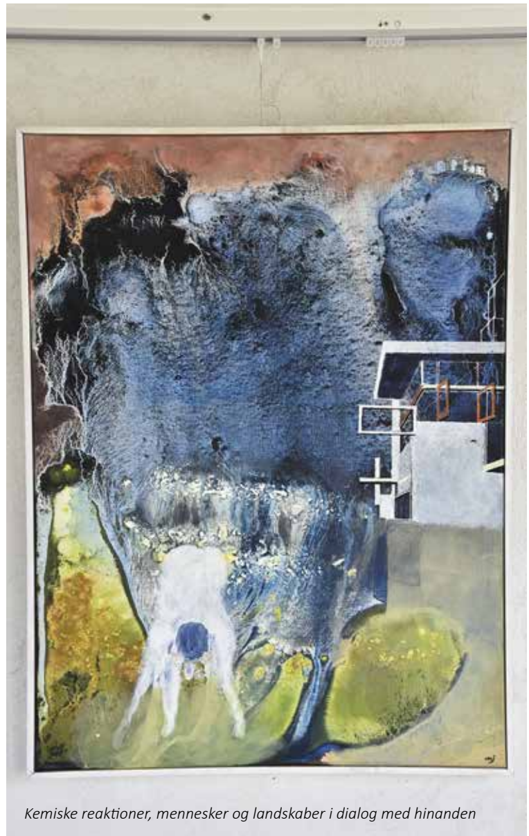
Kemiske reaktioner, mennesker og landskaber i dialog med hinanden